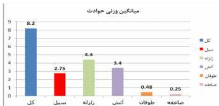
نمودار ۱- میانگین آمادگی کتابخانه‌های دانشگاه علوم پزشکی قزوین در برابر حوادث طبیعی