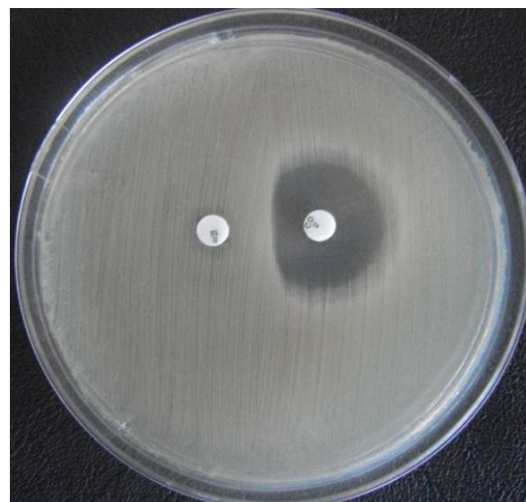
شکل ۲- آزمون مثبت القایی D نمونه شماره ۲۱ استافیلوکوکوس اورئوس جدا شده در این مطالعه

ستون M: DNA مارکر (۱۰۰bp)، ستون ۱: شاهد مثبت دارای ژن femA، ستون ۲: شاهد منفی فاقد ژن femA، ستون‌های ۳ تا ۷: ایزوله‌های بالینی مثبت از نظر حضور ژن femA، ستون ۸: شاهد آزمون (واکنش PCR بدون DNA الگو)