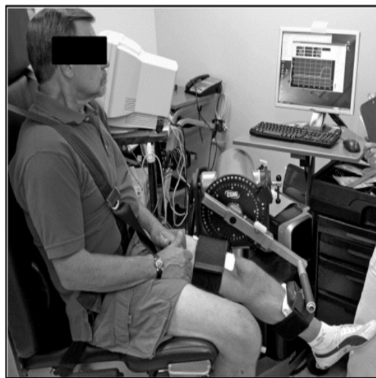
شکل ۱- وضعیت قرارگیری آزمودنی‌ها روی دینامومتر برای اندازه‌گیری قدرت فلکسور و اکستنسور زانو (۱۳)

قدرت ایزومتریک فلکسورها و اکستنسورهای مفصل زانو با استفاده از یک دینامومتر ارزیابی شد. قدرت در اندام مبتلا به آرتروز مفصل زانو و اندام راست افراد سالم اندازه‌گیری شد. قدرت فلکسور و اکستنسور زانو در حالی که آزمودنی‌ها در وضعیت فلکشن ۸۵ درجه ران و فلکشن ۶۰ درجه زانو نشستند ارزیابی شد (شکل شماره ۱).