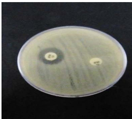
شکل ۱- شناسایی فنوتیپی سویه‌های تولید کننده متالوبتالاکتاماز به روش DDST

برای تأیید سویه‌های مولد بتالاکتاماز وسیع‌الطیف به روش دیسک دیفیوژن نشان داد تمامی نمونه‌های مقاوم سودوموناس آئروژینوزا از لحاظ وجود ESBL، مثبت بودند. با شناسایی فنوتیپی نمونه‌های سودوموناس آئروژینوزا تولید کننده متالوبتالاکتاماز به روش DDST از ۴۲ نمونه سودوموناس آئروژینوزا مورد بررسی، ۲۶ نمونه (۶۱/۹ درصد) به عنوان سویه‌های MBL شناسایی شدند (شکل شماره ۱).