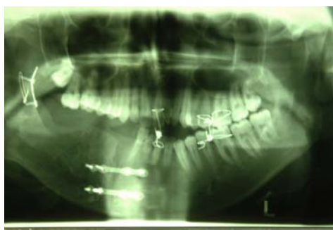
شکل ۳- رادیوگرافی پانورامیک یک سال پس از عمل جراحی

شریان مربوطه در دسترس قرار گرفت تا در صورت نیاز Ligation انجام شود. با دسترسی داخل دهانی مخاط باکال و لینگوال از ناحیه دندان سانترال سمت چپ تا ناحیه شاخه صعودی به طور کامل تا لبه تحتانی فک پایین کنار زده شد. استخوان فک پایین در سمت راست از محل بین دندانهای سانترال و حدود یک سانتی‌متر دیستالی‌تر از ضایعه در بخش خلفی در ناحیه شاخه صعودی پس از جدا کردن از نسج نرم، برداشته و به خارج از دهان منتقل شد. سپس کل ضایعه عروقی در بخش مرکزی استخوان کورتاژ و جهت بررسی آسیب‌شناسی ارسال شد در ضمن دندان عقل نهفته با ضایعه کیستیک همراه آن خارج شد. سپس استخوان بریده شده، جهت بازسازی فک در موقعیت صحیح خود پس از انجام فیکساسیون بین فکی و گرفتن اکلوزن، توسط ۳ عدد پلاک و ۱۰ عدد پیچ و سیم ثابت شد و نسج نرم مخاطی به طور کامل دوخته شد (شکل شماره ۳).